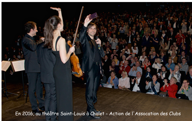
En 2016, au théâtre Saint-Louis à Cholet - Action de l'Association des Clubs

pianistique moderne du récital : un virtuose qui a inventé les concerts en sortant la musique des salons, pour la partager avec le peuple. Les œuvres grandioses de Beethoven qui ont amorcé le courant romantique. Franz Schubert, qui a laissé une œuvre majeure. Claude Debussy inspiré par la peinture impressionniste. Rachmaninov, pour la puissance et l'ampleur sonore que le piano à queue restituerait si puissamment. Et Erik Satie pour l'improvisation et son univers plaisant.