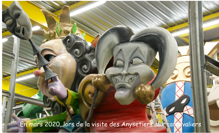
En mars 2020, lors de la visite des Anysetiers aux carnavaliers

Quelques dates : Jusqu'en 1914 le spectacle était gratuit. Les chars décorés étaient fabriqués par quartier ou par des associations au bon vouloir des Choletais.