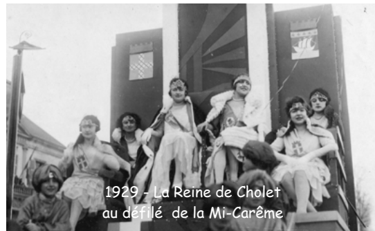
1929 - La Reine de Cholet au défilé de la Mi-Carême

jour du carnaval, elles défilent sur un char spécialement aménagé pour les mettre en valeur. Elles sont reçues solennellement par les autorités municipales.